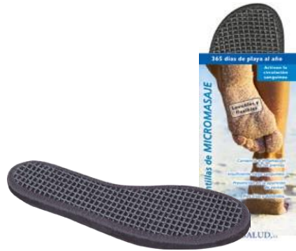
Tallas: 36 /46